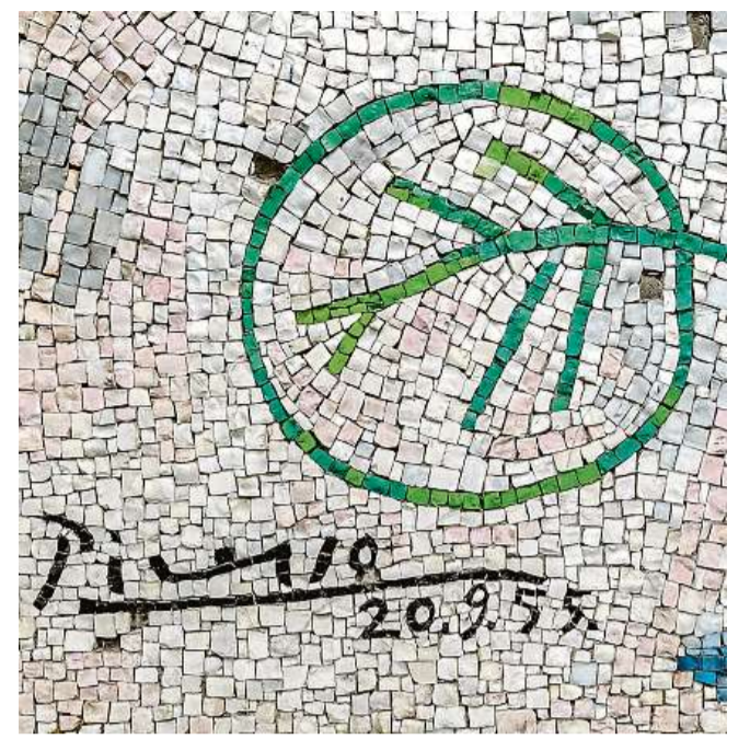
Kresbu květiny složené z lidských rukou, ze které návrh pražské mozaiky vychází, věnoval španělský malíř a sochař Pablo Picasso v roce 1955 Světové odborové federaci k desátému výročí jejího založení. Skleněnou mozaiku podle této předlohy vytvořil v roce 1980 Italo Sauro Ballardini v recepci jedné ze tří budov brutalistního komplexu na Vinohradské třídě. Italský malíř a mozaikář Ballardini v Praze vystudoval akademii výtvarných umění a ve veřejném prostoru české metropole zanechal ještě několik svých děl.