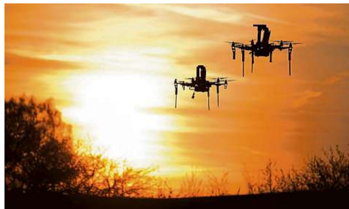
Vstřícní budoucnosti. Vědci z Fakulty elektrotechnické ČVUT loni předvedli, jak eliminovat cizí drony v zakázané oblasti elektráren či vládních budov.

Ta se ocitla v zajímavém „klubu“ s Dánskou technickou univerzitou, francouzskou École Polytechnique, eindhovenskou technikou i s Technickou univerzitou Mnichov (TUM). Novým členem je ještě polytechnika z estonského Tallinnu. Skupinu pak doplňuje izraelský Technion, který je silným pojmem sám o sobě.