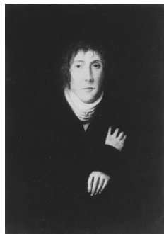
Philipp Bozzini (1773 – 1809)

1806 První zaznamenaný endoskopický pokus, který provedl P. Bozzini. Instrument byl nazýván "einer Lichtleiter" a byl užit k vyšetření uretry, měchýře a vaginy.